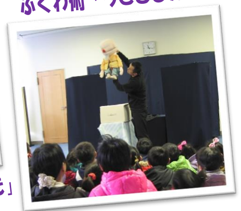
ふくわ術「うさぎとカメ」

3月10日、越前地区の年中・年長保育園児を対象とした毎年恒例の『おはなしひろば』が開かれました。保育園児のみなさんの興奮ぶりに、今年も驚かされました。