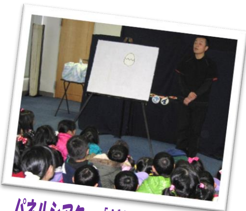
パネルシアター「だれのたまごかな」