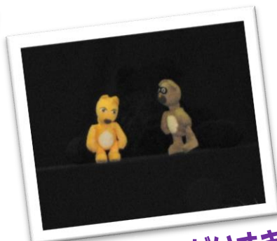
人形げき「パンだいすき」