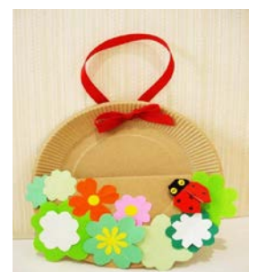
壁掛けポケットを作りました♪

お話の広場では、毎月1・2回程度(木曜日)、ボランティアの方と図書館司書が読み聞かせをします。絵本を楽しんだ後、工作をする時もあります。5月は、21日と28日の予定です。※小学校1～3年生が対象です。詳細は、学校を通じてお知らせしています。