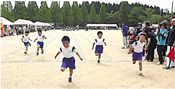
みんな早いね〜 ゴ〜〜ル!!