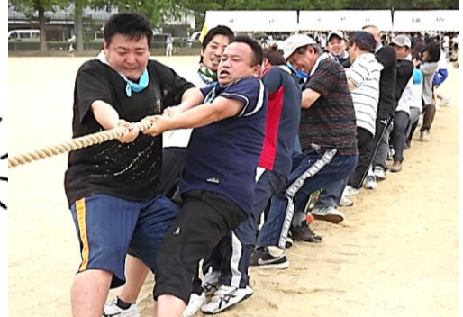
そ〜れっ!! 息を合わせて入賞目指すぞっ!