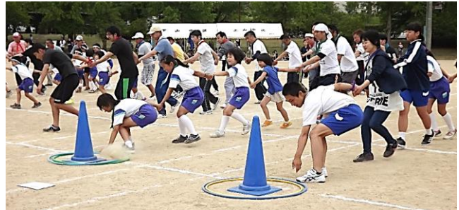
さあ〜手を離さずに速くぐってフラフープを送って!