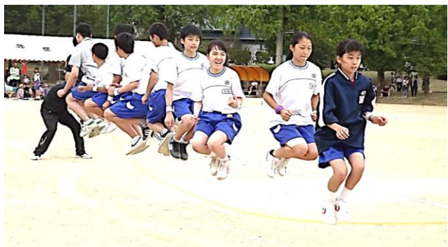
新種目「大縄跳び」跳んでとんで JUNP ジャンプ!!