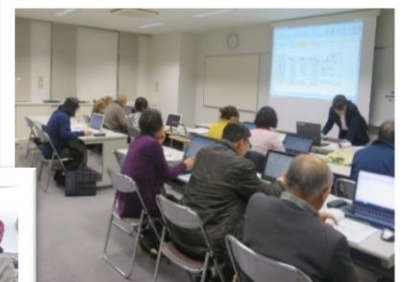
パソコン講座 (家計簿や収支決算の作成をマスターしよう)