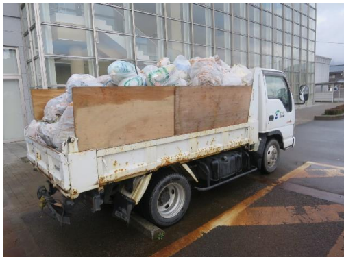
【回収されたゴミの様子】

これからも河川への不法投棄をなくし、美しいふるさとをみんなで守り続けていきましょう。