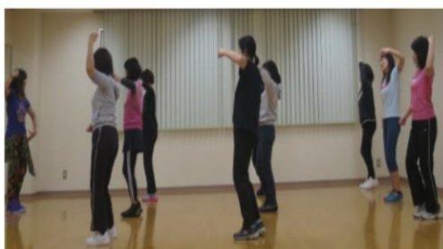
ズンバ・エクササイズ

「こんなことをやってみたい」「こんな講座があったらいいな」などご希望の講座がありましたら、お気軽にお申しつけください。