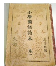
昭和7年発行 小学校1年「国語」