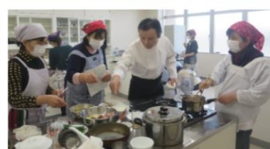
早春のフランス料理教室