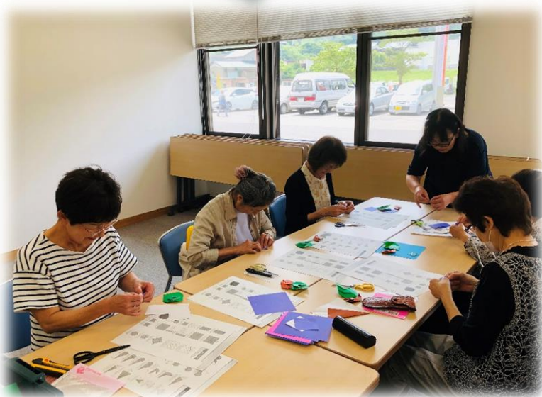
普段の活動の様子