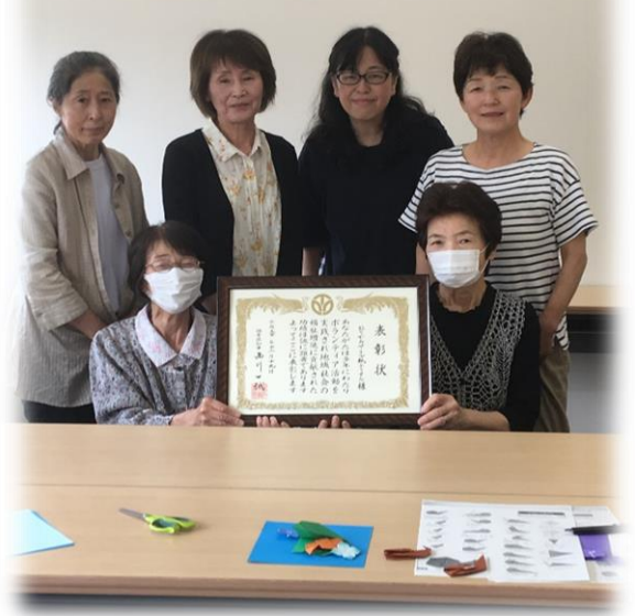
知事表彰を受けて