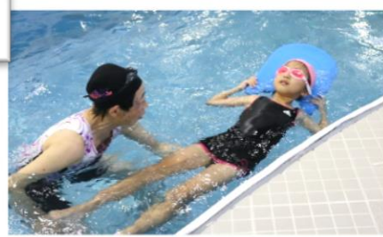
仰向けでのバタ足にも挑戦！！