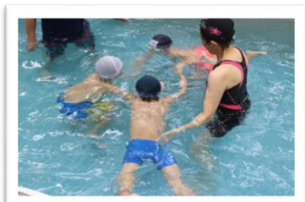
誰が一番長く潜れるかな？！