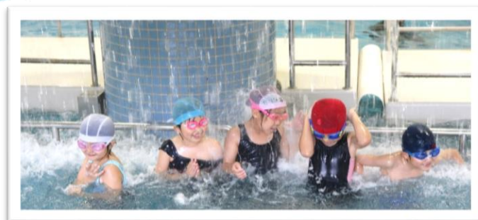
休憩時にはこんな修行も？！

6月30日・7月6日・7日の3日間、アクティブハウス越前にて、越前町スポーツ協会越前支部主催による水泳教室を開催しました。