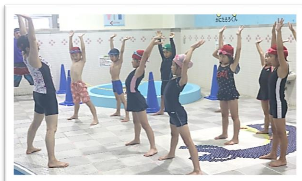
準備体操もしっかりします！