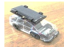
光で走るソーラーミニカー

地球温暖化の現状や原因をくわしく学べる講座です。地球の未来のためにできることをみんなで考えてみましょう。エネルギーのことが分かる楽しい工作もありますよ。