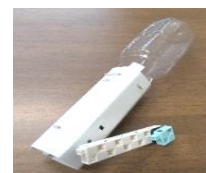
手回し発電ライト