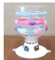
クリスタルランプ