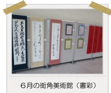
6月の街角美術館（書彩）