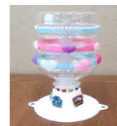
クリスタルランプ