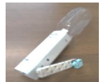
手回し発電ライト