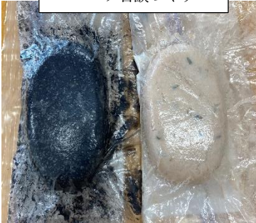
ハーブ石鹸づくり