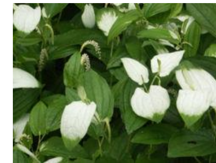
はんげしょう はな 半夏生の花