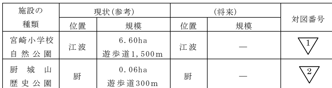
森林の総合利用施設の整備計画

この場合、憩いの場としての整備のため、間伐材を利用した東屋等を設置する。また、森林所有者との協定により、定期的に森林整備を行う。これらの事業を関係補助事業を活用し、積極的に推進することとする。越前地区厨城山歴史公園周辺の森林については、森林とのふれあいの場としての整備が期待されていることから、景観を維持向上するために植栽、不良木の除去とともに、遊歩道の施設の維持を進めることとする。