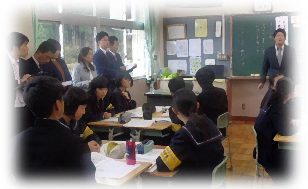
織田地区合同で 授業研究