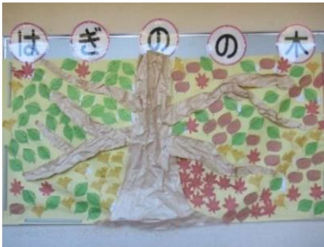
いいね！の気持ち 「はぎのの木」