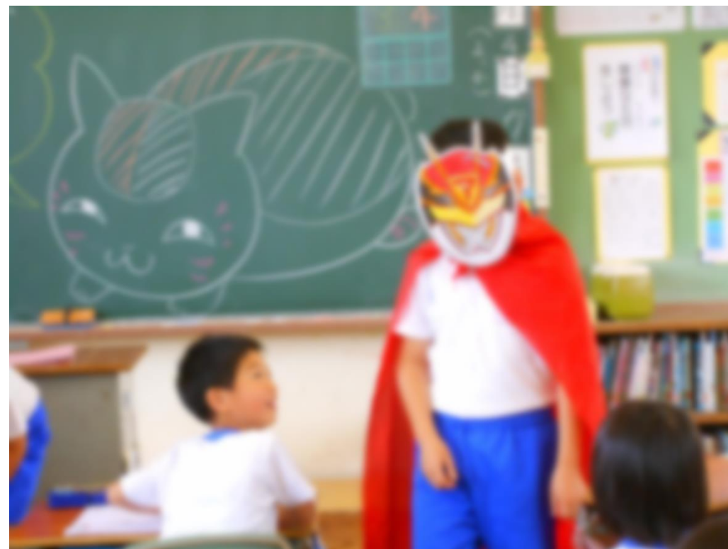
あいさつ運動 生活委員会