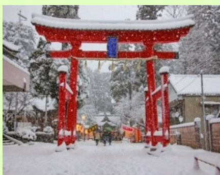
▲織田信長にゆかりのある餌神社