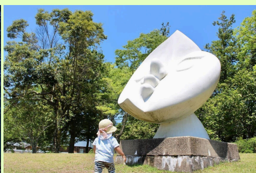
▲岡本太郎など有名作家のモニュメントや陶芸体験が楽しめる越前陶芸村