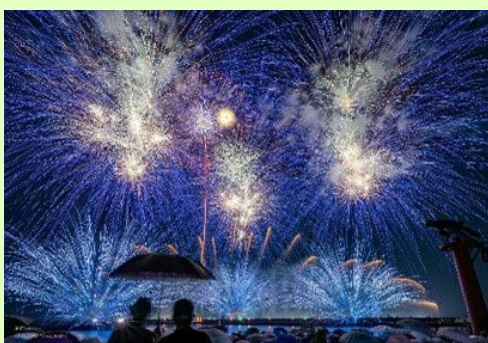
▲毎年海上で行われる越前みなと大花火